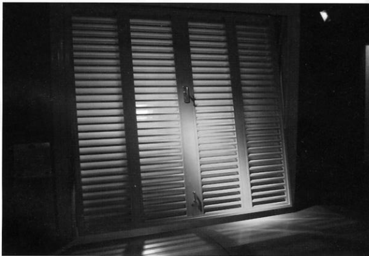
La porta basculante aletata messa in mostra a 100% Colors.

Il palcoscenico di Saiedue 2006 ha costituito per Greppi Holding, produzione e commercializzazione di porte e chiusure residenziali e industriali, l'occasione per mettere in mostra la vasta offerta di chiusure, tutte rigorosamente certificate secondo la norma EN 13241-1. Greppi dispone di una gamma pressoché infinita di soluzioni, che consentono di soddisfare anche il cliente più esigente: sono più di 12mila le varianti di mo-