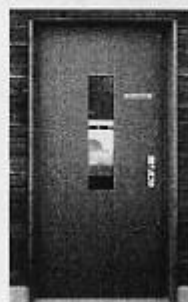
Porte in acciaio. Produzione FG Falsone.

La forma essenziale dei profili consente una realizzazione razionale e un'estetica pregevole. I battenti dispongono di una doppia guarnizione di battuta; per la soglia, a seconda dei modelli è prevista una guarnizione abbassata automatica o una guarnizione a battuta.