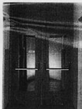
Porta Hotel Rei 120 a due ante, finestrata, con maniglioni antipanico. Produzione Greppi Holding.

L'anta è formata da pannello ad incollaggio ureico e massello perimetrale di legno massiccio di rovere con spessore 47 mm (Rei 30), 66 mm (Rei 60) e 85 mm (Rei 120), rivestito su ambo le facce con impiallacciatura a scelta, con laminato o con laccatura.